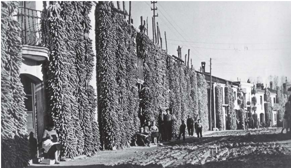
Figura 1. Panotxes assecant-se, 1937. L'activitat econòmica del poble era eminentment agrícola (AML).