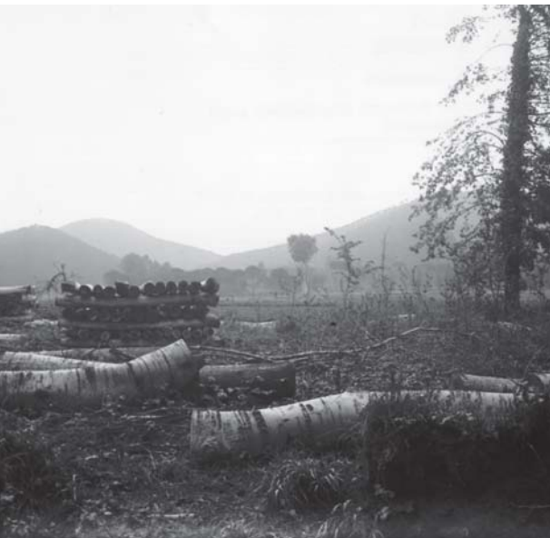
Figura 5. Tala d'arbres prop de la Verneda i la font d'en Gil, 1919 (SPALDB. Arxiu Ricart).

L'acolliment de refugiats va suposar un gran esforç per als habitants de la Llagosta. A l'inici de la guerra, el Consistori es va oferir a contribuir en l'ajuda als refugiats; el setembre de 1936 es va demanar a Socors Internacional que enviessin 30 nois refugiats que es trobaven a Barcelona per repartir-los entre els veïns de la Lla-