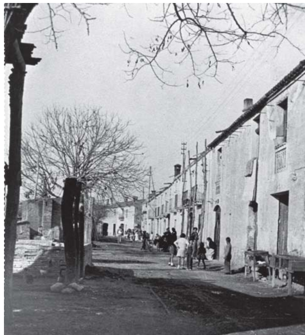
Figura 4. Quitxalla al carrer Garcia Hernández, 1938. Avui, carrer Sant Pau.