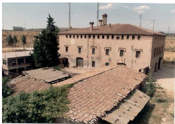
Figura 9. Masia de can Pere Gil. La incautació de can Pere Gil va ser una font de conflicte entre l'Ajuntament de la Llagosta i l'Ajuntament de Mollet durant el període de la guerra (AMLI).