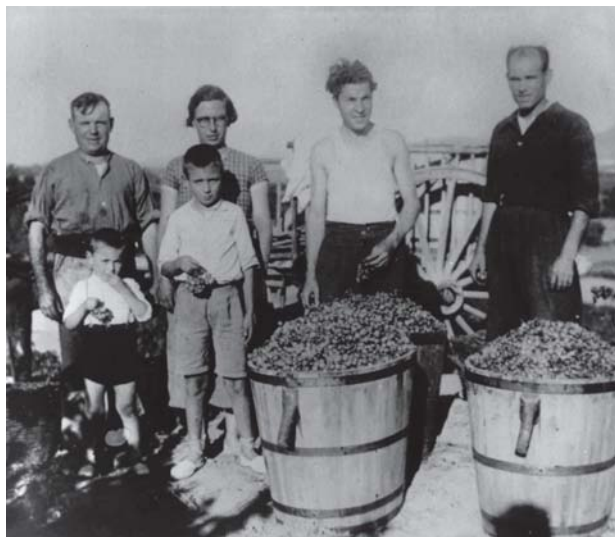
Figura 12. Vinya de Can Payàs, 1937/38. Molts dels pagesos es dedicaven al conreu de la vinya i les patates.

No sabem el nombre total d'homes que van ser mobilitzats o es van incorporar a la guerra; només en tenim dades parcials. Sabem que entre la lleva de 1919 i la de 1928 van ser cridats a files 30 homes, que tenien entre 31 i