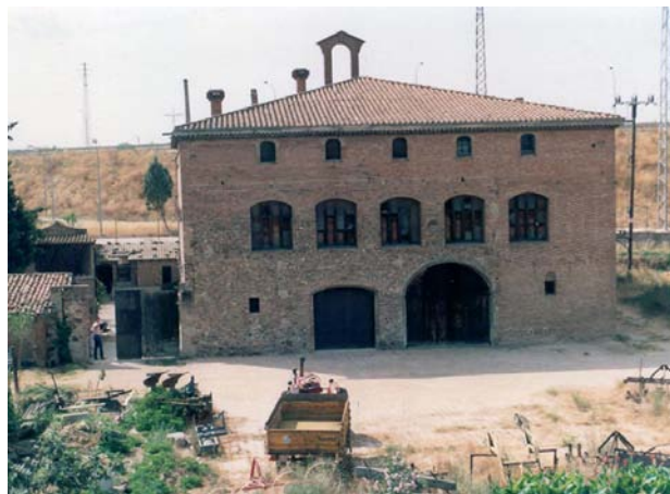
Figura 11. Masia de can Pere Gil. L'afer de can Pere Gil va ser el problema més gran que va patir l'Ajuntament de la Llagosta, fins al punt que va provocar la dimissió del Consistori en dues ocasions.