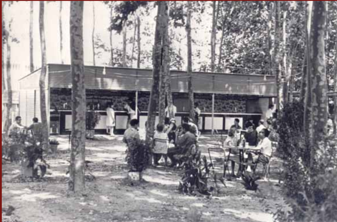
1966. Restaurant "La arboleda"

«...era sortint cap a Mollet, a prop del camp de futbol i de l'encreuament de Santa Perpètua. Aquí s'hi celebraven tots els casaments, batejos i comunions de l'època i cada cap de setmana hi havia ball amb un grup musical en directe.»